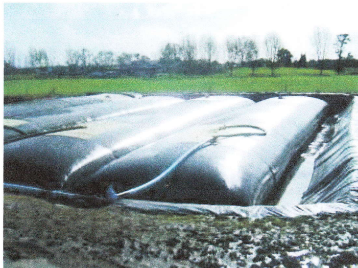
Belgir úr gegndræpum jarðvegisdúk (e. Geotextile membrane) fyrir fast efni úr skiljum.

Líkan af eldiskerjum. „Bottom drain“ en þar fellur u.þ.b. 10% af eldisvatni ásamt lífrænum úrgangi sem fellur til botns. Yfirfall flæðir í loftunartank og nýtist áfram.