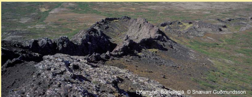
Ljósmynd: Búrfellsgjá.

Skipuleggja svæðið með tilliti til útivistar og fræðslu..