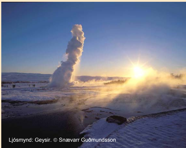
Ljósmynd: Geysir. © Snævarr Guðmundsson