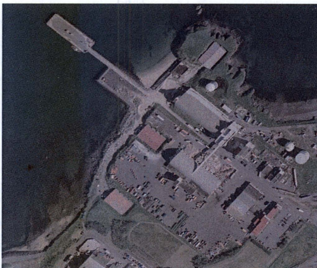
Mynd 1. Höfuðstöðvar Íslenska Gámafélagsins í Gufunesi

Íslenska Gámafélagið er með höfuðstöðvar í Gufunesi í Reykjavík en er einnig með starfsstöðvar í Árborg, Reykjanesbæ, Akureyri, Reyðarfirði, Egilsstöðum, Vestmannaeyjum og víðar. Fyrirtækið sér um að þjónusta flestar móttökustöðvar Sorpu, ásamt því að þjónusta fjölda annarra fyrirtækja. Á einstaklingsmarkaði þjónustar