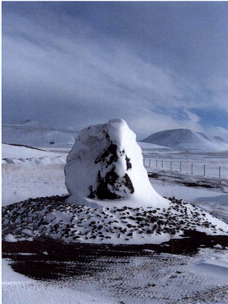
Vetur í Stekkjarvík.